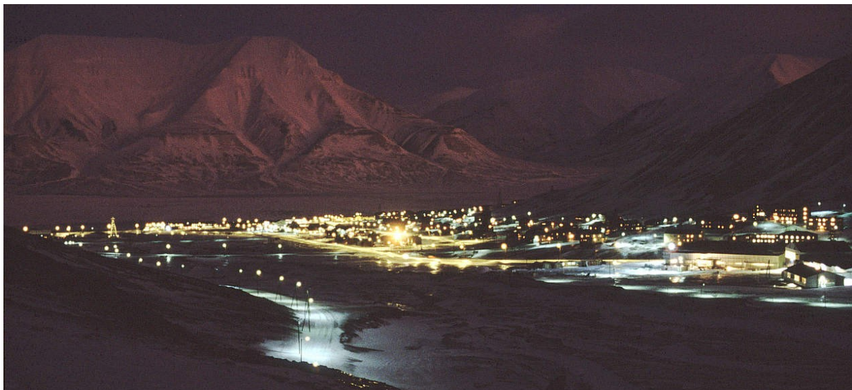
Longyearbyen in der Polarnacht – das Licht des Ortes wird von den umliegenden Bergen schwach reflektiert

Mehr noch, als in den hellen Jahreszeiten, muß sich das Programm in der Polarnacht an den aktuellen Wetter- und Naturgegebenheiten orientieren und wird daher vom Reiseleiter in Absprache mit den Teilnehmern von Tag zu Tag festgelegt: Erkundung des Ortes, Wanderungen hinaus auf die Tundra oder eventuell sogar auf einen der nahen Bergrücken, Hundeschlittentour: wir wollen möglichst oft auch aus dem Ort hinaus kommen, weg vom künstlichen Licht, um mit angepaßten Augen zu erleben, was allein mit Mond-, Sternen- und eventuell Nordlicht und dem reflektierenden Schnee trotzdem erkennbar ist. Genauso kann es aber auch passieren, daß uns ein Schneesturm mal ins Haus fesselt – auch das gehört zur winterlichen Arktis.