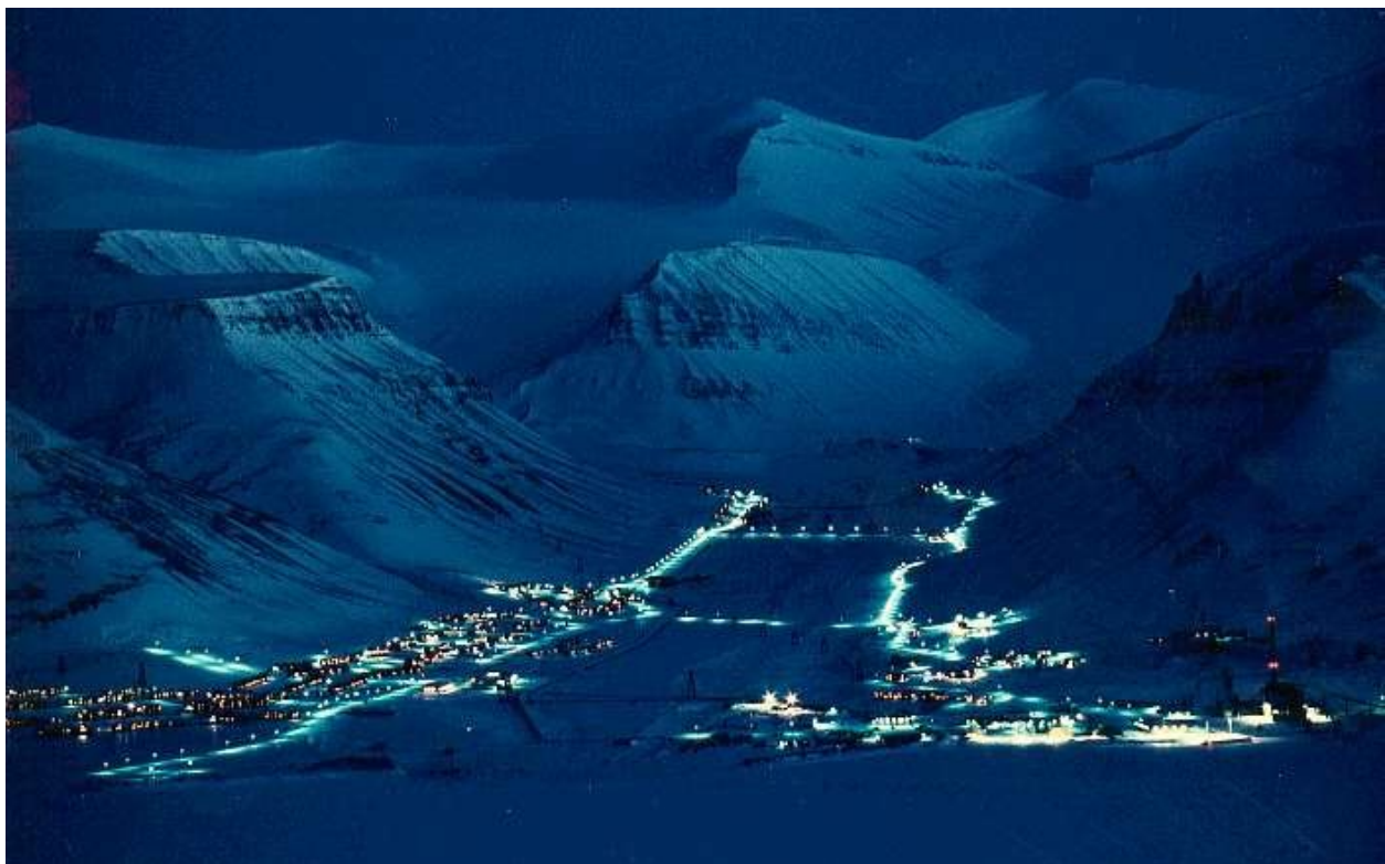
Longyearbyen im Mondlicht, während eines Ausfluges auf einen der Berge auf der anderen Buchtseite fotografiert.

Bei Beachtung dieser Regeln ist das Restrisiko durch Eisbären als eher gering einzustufen (und längst nicht jede Trekkinggruppe bekommt einen Bären zu sehen). Restrisiken nimmt übrigens jeder Teilnehmer andernorts ganz selbstverständlich in Kauf, ohne sich allzu große Sorgen zu machen, etwa im Straßenverkehr, obwohl dieser in Mitteleuropa jedes Jahr Tausende von Toten fordert, darunter viele völlig Unschuldige, und auch in Spitzbergen sterben mehr Menschen durch andere Freizeitunfälle (Ertrinken, Erfrieren, Verletzungen bei Stürzen), als durch Eisbären.