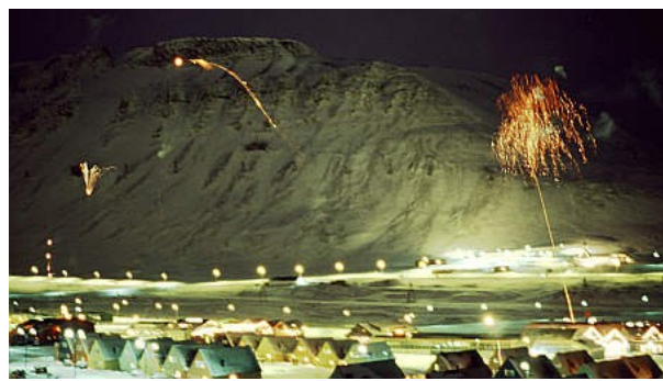
Silvesterfeuerwerk der Einheimischen im Ortszentrum, von einer der benachbarten Höhen aus beobachtet