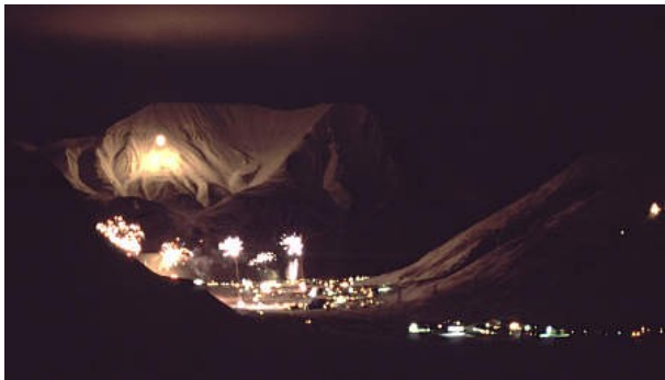
Silvesterfeuerwerk erleuchtet die umgebenden Bergflanken

Lichtverhältnisse: So hoch in der Arktis ist es um Neujahr selbst mittags praktisch wirklich dunkle Nacht – bei sehr klarem Wetter kann man nach Süden hin eine ganz schwache Aufhellung des Nachthimmels erahnen. Bei klarem Wetter spielen Mond- und Sternenlicht, unterstützt von reflektierendem Schnee, eine überraschend große Rolle und erlauben dann relativ gute Sicht in der Nacht, hinzu kommt dann eventuell auch noch das magische Nordlicht. Bei bedecktem Himmel oder gar Nebel kann es aber auch absolut finster sein. Im Ort selbst gibt es für alle wesentlichen Straßen reichlich elektrische Beleuchtung. Beim Verlassen dieser beleuchteten Bereiche ist daher eine langsame Anpassung der Augen an die Dunkelheit erforderlich.