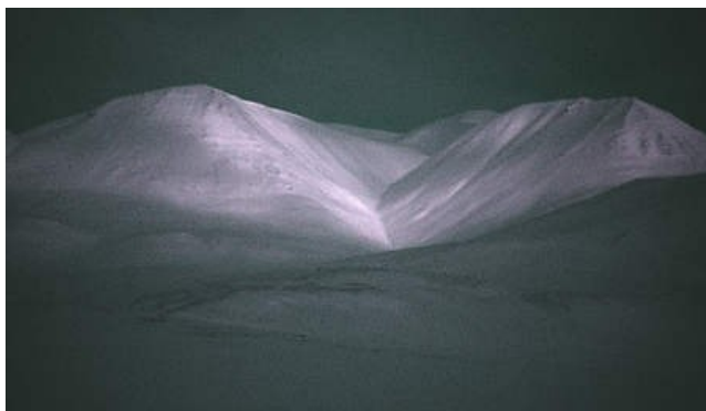
Durch ein Wolkenloch fällt bei Vollmond das überraschend kräftige, milde Mondlicht auf Teile der Bergwelt

Warme Mahlzeiten – in der Regel gute Portionen – sind im Ort ab ca. NOK 100 erhältlich. Um den Jahreswechsel sind die Öffnungszeiten der Geschäfte in Longyearbyen sehr begrenzt (mehrere Tage sogar geschlossen) – frühzeitig noch benötigte Dinge einkaufen !