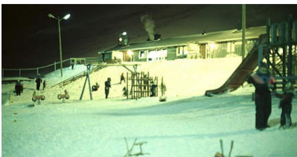
Für die Einheimischen ist die Polarnacht Alltag: Kinder spielen tagsüber, in Thermoanzüge gehüllt, im Außenbereich eines Kindergartens

Programmergänzungen: In manchen Jahren eignen sich die Schnee- und Wetterverhältnisse auch für eine Motorschlittentour – eine solche kann ggf. vor Ort kurzfristig vereinbart werden (Umlegen der Kosten auf die beteiligten Gäste). Eine weitere Ergänzungsmöglichkeit ist eine geführte Bergwerkstour (ca. NOK 590 pro Teilnehmer).