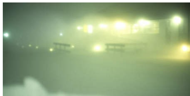
Schneesturm verhüllt die Hauptstraße im Ortszentrum: bei solchem Wetter bleibt man nicht lang draußen.